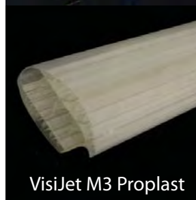
VisiJet M3 Proplast