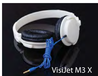
VisiJet M3 X

* Disclaimer: E' responsabilità di ogni cliente stabilire che l'uso di qualsiasi materiale VisiJet con certificazione USP Class VI è sicuro, legale e tecnicamente idoneo per le applicazioni previste dal cliente. I clienti dovrebbero condurre i propri test per assicurare che questi requisiti siano soddisfatti.