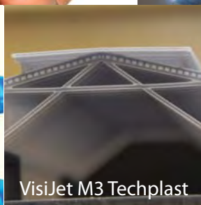
VisiJet M3 Techplast