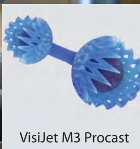
VisiJet M3 Procast

Materiali Plastici VisiJet M3 per ProJet 3500 SD & HD