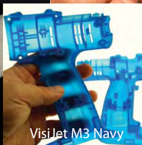
VisiJet M3 Navy