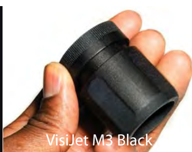
VisiJet M3 Black